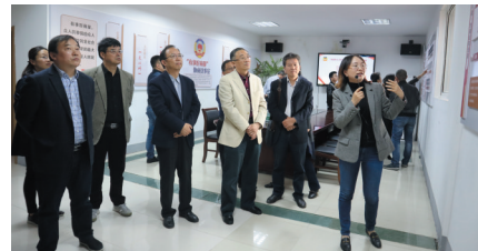
政协委员调研“有事好商量”协商议事室。