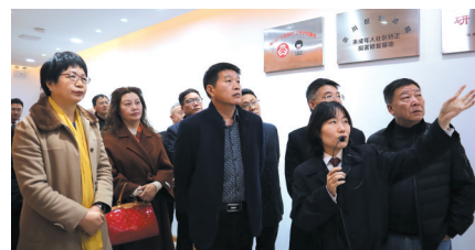
区政协调研崇川区励志园观护基地。