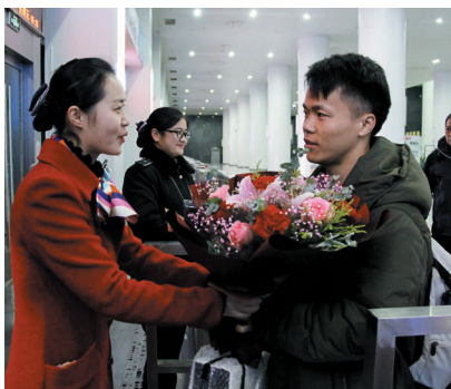
鲜花送给第一班旅客。