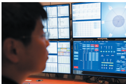
1月9日,工作人员在“中国天眼”总控室内工作。

射电暴起源、星际分子等前沿方向催生突破。中科院国家天文台正在积极组织国内外专家,研究如何发挥“中国天眼”优良性能,加强国内外开放共享,推动重大成果产出。 齐健