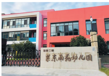
已开园的紫东南苑幼儿园。