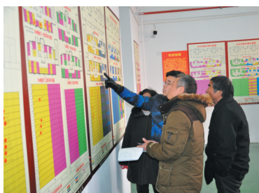
安置小区兴石花园分房现场。