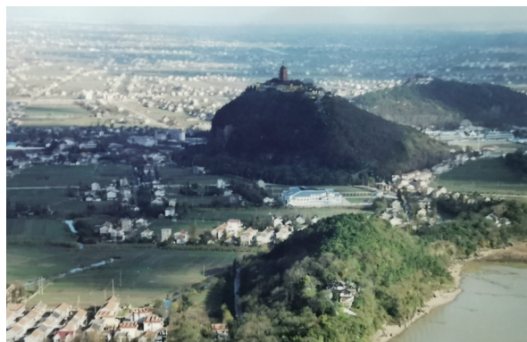
上世纪八十年代的狼山。