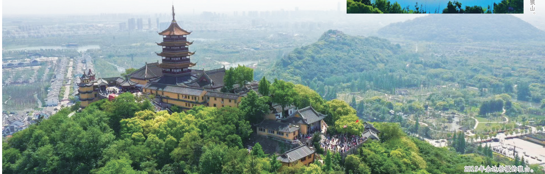
2019年余达拍摄的狼山。