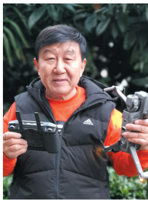
现在有了无人机航拍更自由。