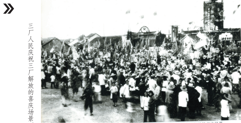
三厂人民庆祝三厂解放的喜庆场景。

1949年2月2日,江苏长江以北的政治、经济和文化中心南通城解放。取得军事胜利以后,党和政府迅速而有效地接管了南通城,实现了社会和经济秩序的平稳过渡和迅速恢复,为历史留下了如何对一个具有相当工业基础的城市进行有效接管的范例。而有效接管的关键,就是当时南通的经济命脉——大生厂的保全和复工。