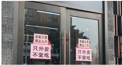
店门外贴上“只外卖,不堂吃”的告示。