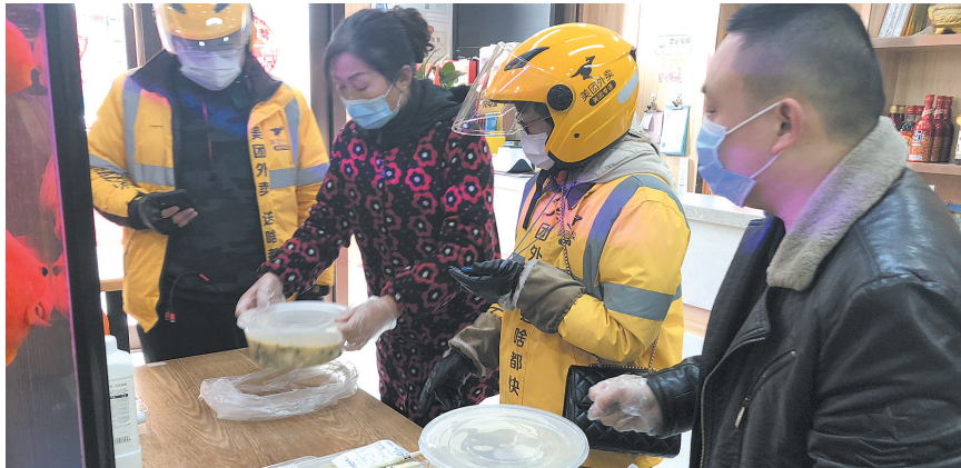
工作人员和外卖人员正在配餐。