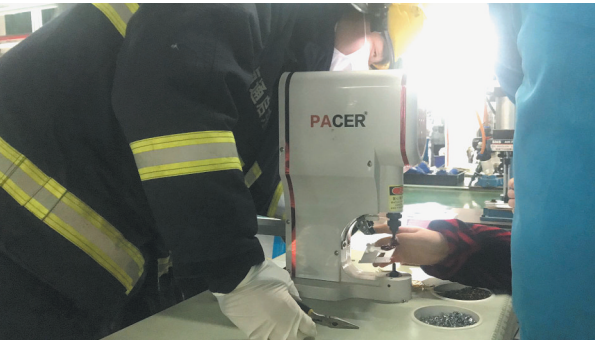
消防人员正在进行解救。 陈家波

晚报讯 3日上午,江苏启东百特电器正在加紧复工复产,一名女员工在操作台作业时,右手大拇指不幸被铆钉机撞针穿透,卡在了操作台上血流不止。当地消防救援人员到场后,经过5分钟紧张救援,该女子右手大拇指从机器缝隙中成功解救出来。 当日上午9时12分,启东市消防救援大队指挥中心接到报警称:位于滨海工业园区汇海路百特电器有人手指卡在机器里。接到报警后,指挥中心立即调派启东滨海中队到达现场处置。在现