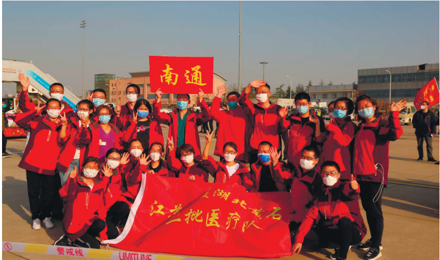
南通援黄医疗队抵达南京。