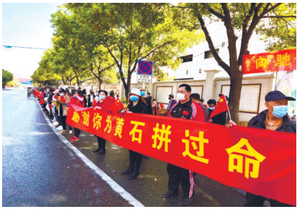
黄石市民送别医疗队。

晚报讯 南通援鄂英雄,欢迎你们回家!昨晚8点左右,37名南通援黄石医疗队首批返程人员平安抵达南通,沿途警车护送,市民热烈欢迎。37名医护人员中有26人来自省属、市属医院,11人来自区县医院。