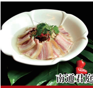
南通君庭假日酒店

地址:工农路486号 电话:18962997979 活动主题:春鲜正盎然 君庭寻新味 活动内容:酒店疫情期间推出:非常“食”刻 君庭暖心外卖 美团特惠家宴套餐 重点推荐:春季特色(特价)菜品或家宴 1.极品刀鱼馄饨(特色) 2.生态天目湖鱼头(特色) 3.荠菜黄鱼春卷(特色) 4.秘制私房豆腐(特色) 5.养身河豚鱼火锅(特色) 5、君庭秘制龙虾(特色)