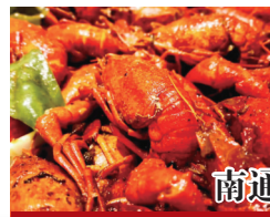
南通锦江花园酒店

地址:南通市人民中路200-7号电话:85325889 活动主题:锦江花园酒店第六届龙虾美食节 活动时间:4月1日至6月30日 活动内容:江水龙虾 味香飘逸、回味无穷 酒店推出:网红海陆空龙虾大咖套餐 重点推荐:春季特色(特价)菜品或家宴 1280元/席6-8人(四款口味,16斤龙虾+6冷+6热) 1680元/席10-12人(五款口味,20斤龙虾+8冷+8热) 凭健康码码品尝海陆空龙虾套餐每桌立减100元。