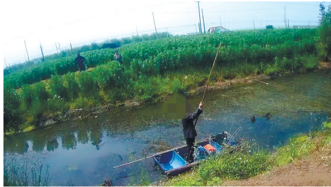
捕鱼。嫌疑人正在河道内电捕。葛福生 单媛媛

晚报讯 4月20日上午，海门市农业综合执法大队接群众举报称：临江新区十二横河内有人进行非法电捕鱼，执法人员迅速前往，现场查获嫌疑人员1名，电捕工具1套，涉案渔船1艘，并将嫌疑人捕得的8.1公斤渔获物现场放生，对其违法行为进行立案。目前，本案正在进一步办理中。