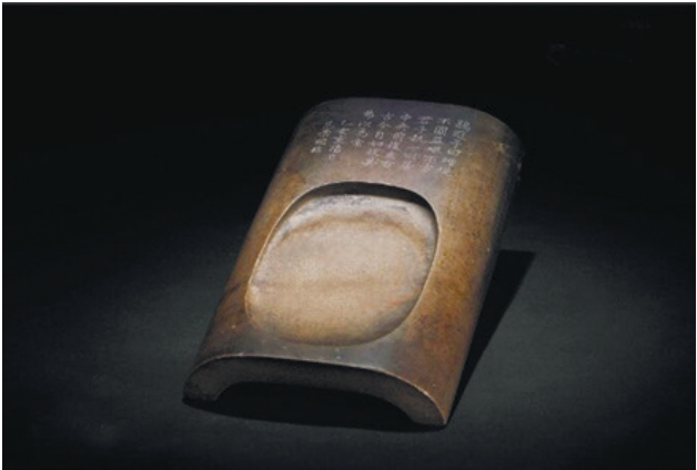
范迦陵撰铭并刻澄泥瓦形砚