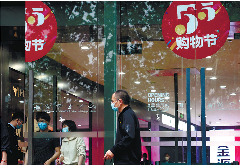
上海淮海路一家商场的“五五购物节”标识(5月5日摄)。

4分钟后,中国银联、支付宝等支付渠道实时监测数据显示,上海地区消费支付额突破1亿元。