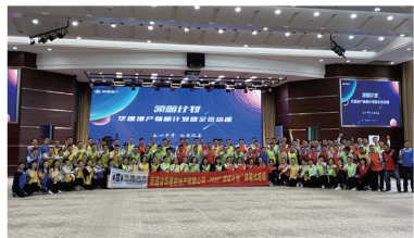
图为华德地产企业培训现场

而在时代力量涌现前,华德已经坚定地立于潮头,深耕南通,辐射长三角,发展珠三角市场……进驻9座城市近30个项目,信心满怀。一路走来,将经验垒为阅历,所长蓄成锋芒,以责任心和使命感,缔造生活品质,成就城市新格局。