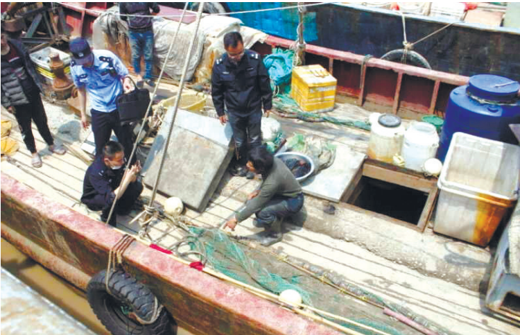
4日上午,启东市公安局水警大队联合长航南通公安分局启东派出所所在长江启东段北堡港外水域查获3条非法捕捞渔船,共抓获9名嫌疑人,共缴获渔获物约60公斤。9名嫌疑人现已被依法取保候审,案件在进一步办理中。图为执法现场。 记者张亮 通讯员孙鼎

到交通事故及意外事故伤害,由被保险人承担的经济赔偿责任,由保险公司按照合同约定负责赔偿。因此,根据合同约定,雇主应先赔偿雇员,再向保险公司主张赔偿。东家不赔、保险公司也不赔,于某家属无奈之下提起诉讼。 如东法院审理认为,A公司与保险公司签订的雇主责任保险合同合法有效,双方应依照约定履行合同义务并享受权利。被保险人的雇员于某在保险期间内,在下班途中发生交通事故,造成死亡,属保险合同约定的保险责任范围。在A公司作为被保险人(雇主)未给付赔偿金,也未向保险人请求赔偿保险金的情况下,于某的法定继承人享有其应获赔偿部分直接向保险人请求赔偿的权利。被告提出的应由雇主向保险公司主张保险赔偿的抗辩理由不能成立。故法院判决保险公司给付保险金74万余元。一审判决后双方均未上诉。 本报通讯员罗媛 本报记者王玮丽