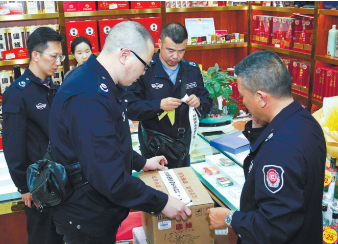
五一假日期间,市烟草专卖局稽查支队联合公安部门开展夜查,共查获公开摆卖的“假、私、非”卷烟案件36起,其中5万元以上的4起,卷烟1800余条,涉案金额39万余元,切实维护了国家和消费者利益。 赵国庆 何家玉

万元发放各类消费券近49万张,使用率达50%以上,拉动消费2000万元以上。 市商务局提醒市民,“云闪付”APP线上报名摇号活动仍将继续,昨天是第5轮摇号报名的最后一天,已经报名的市民无需再报名,会自动默认参与摇号。此外,5月到6月间,我市还将陆续开展“南通老字号·非遗嘉年华”“汽车展”等一系列消费促进活动,激发居民消费激情,拉动消费进一步回暖提升。 记者刘璐