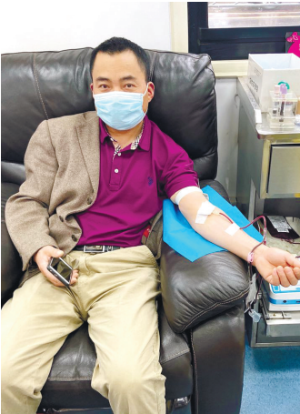
市民纷纷撸袖献血。 马淳滢

晚报讯 五一小长假,本来是家人团聚、外出踏青的好时机,市中心血站的职工仍然奋战在一线,为守护通城人民的健康,默默奉献着。小长假期间,市区共有454人参加了无偿献血,累计捐献全血13.57万毫升。 无论是烈日炎炎还是细雨沥沥,都挡不住市民节日期间献血的热情。在南大街爱心献血屋,不少前来献血的市民,填表、体检、化验、献血等各个流程都井然有序,采血车上的医务工作人员尽心尽