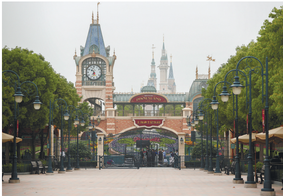
上海迪士尼今复工

3月21日,中国足协于官网宣布已从西班牙人俱乐部获知武磊确诊感染新冠病毒。武磊随后在个人社交媒体上发布视频,表示自己正在西班牙家中隔离,精神状况非常好,症状基本消失。