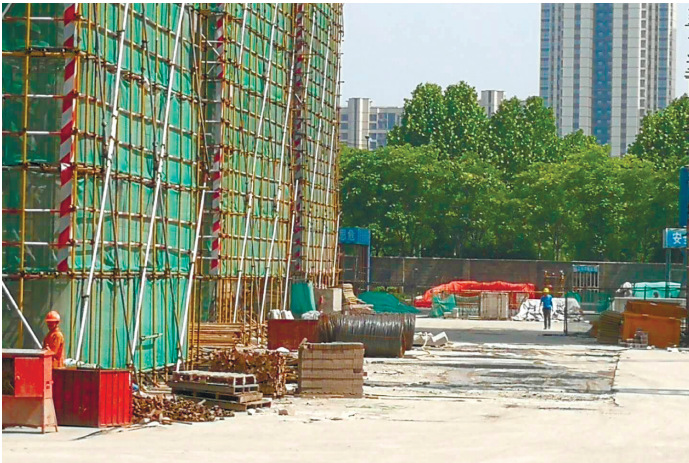
工地内部道路上面一层浮灰。