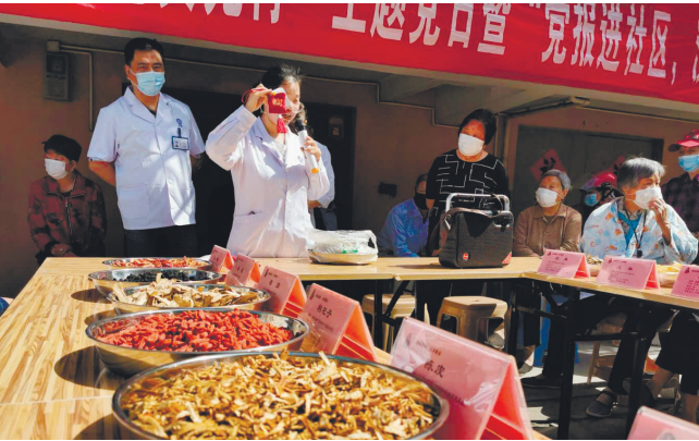
19日，党报进社区系列活动之一的“汉药健康行”主题活动在港闸区唐闸镇街道高店社区举行。南通汉药中医医院医护人员为居民提供中药材辨识、养生防病讲座、中药香囊制作等多个免费服务。 记者陈可

自疫情发生以来，紫琅社区秒入“战备”状态，第一时间成立社区疫情防控“阵地党支部”，以“我是党员我先行”的行动理念面向辖区全体党员发出倡议、吹响集结号。 社区36名党员迅速响应号召，纷纷成为防疫知识“宣传员”、恪尽职守“守门员”、严防严控“侦查员”、居家隔离“观察员”和复工复产“指导员”，把“疫”线作为冬训主战场，涌现出了一批父女、兄妹、祖孙党员组合搭档。 随着复工复产高峰期来临，社区年轻人外出复工，紫琅社区党员志愿者开展“敲门行动”，切实把疫情防控做实、做细、做足，打通社区防控服务居民“最后一公里”。据统计，紫琅社区党员志愿服务队累计服务居民