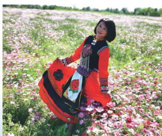
感受美丽的港闸初夏。