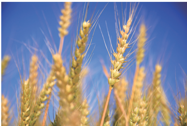
万顷良田麦子丰收。