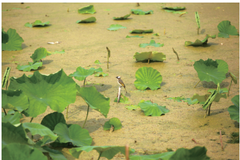
白头翁在荷花池休憩。