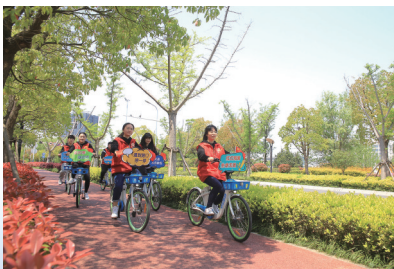
志愿者沿途骑行宣传交通安全。