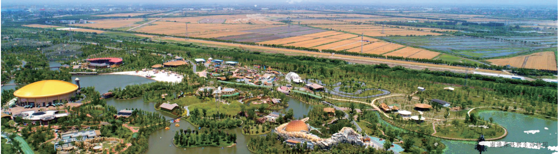
南通森林野生动物园