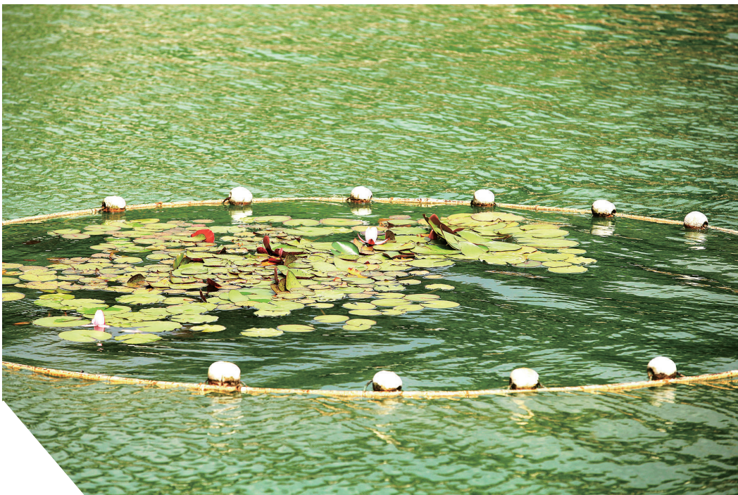
清晨微风吹起,池塘里碧波荡漾,红鲤嬉戏,莲叶托起圣洁的白花。