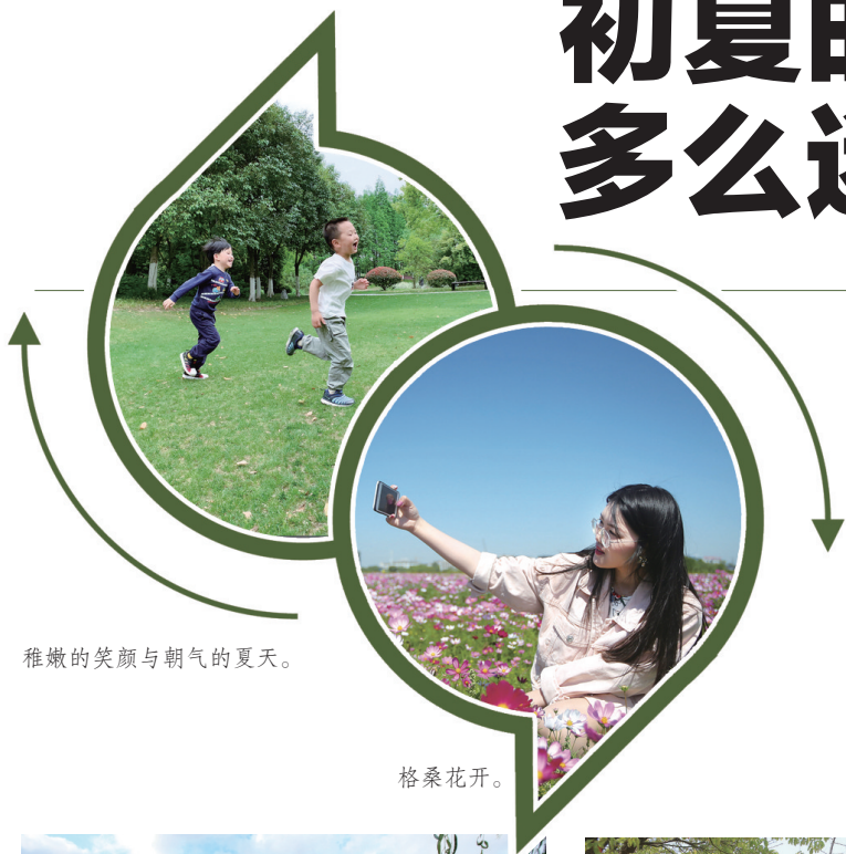
稚嫩的笑颜与朝气的夏天。