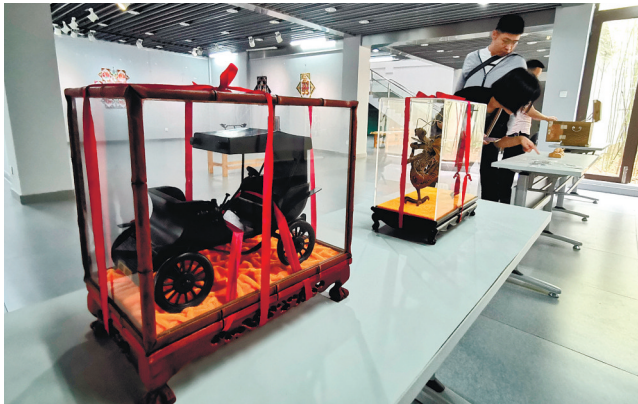
图为展览现场。

晚报讯 “用棕编竟然能做出一条龙,真是太像了,果然高手在民间呀!”5月26日,在南通文艺之家,现场观看“民间工艺助力防疫捐赠作品展”的童振大爷连声赞叹。 在市第十五届“五月风”文艺展示月系列活动民间工艺助力防疫捐赠作品展上,既展现了民间工艺家们精湛的技艺和工匠精神,也展示了他们敢于担当的大爱精神。现场共展出60位民间工艺家捐赠的57件作品,涵盖了如皋丝毯、仿真绣、板鹞风筝、红木雕刻、棕编等富含的南通元素的民间工艺品,参展作者有国学大师、国家级非遗传承人,也有省市级工艺美术大师、民间艺人,作品内容丰富、特色鲜明。民间工艺美术具有丰富深厚的非遗文化意义,通过本次展览,吸引更多的人一起参与保护非物质文化遗产,一起