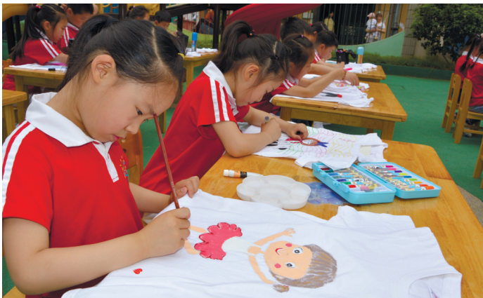
6月1日,崇川区任港街道黎明社区联合瑞丰幼儿园开展活动,孩子们将崇拜的英雄画在白T恤上,讲述自己梦想的职业。 陆凡

组团式服务”,真正实现“发现问题快、隐患消除快、服务推送快”的目标。 在日常管理中,网格员主动“亮身份、亮职责、亮承诺”,认真当好“政策宣传员、信息采集员、问题排查员、基层治理员”,围绕安全生产、城市管理、隐患排查整治等环节,充分挖掘、整合、利用各类服务管理资源,优化网格服务管理,推动服务重心下移,对“小微商圈”实行“网格化、地毯式”管理模式,通过实地了解小微企业疫情防控及复工复产情况,全面掌握小微企业运行安全与疫情防控措施,及时解决小微企业复工复产出现的一系列问题,为小微企业提供优质高效服务。 通讯员赵琪