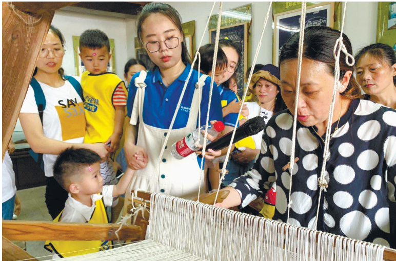
6月4日,南通开发区小海街道紫琅社区关工委、妇联开展亲子教育活动,给孩子们举办了一场别样的非遗文化体验盛宴,让孩子们近距离感受南通蓝印花布传统民俗文化魅力。 黄建平 徐燕

与此同时,竹行街道积极探索群众都能接受的全民普法方式,在所有社区全部建立法润民生微信群,社区法律顾问定期在群里进行法治宣传和法律服务工作。以“12·4”宪法宣传日为主线,集中开展以宪法为核心、以专业法为重点的法治宣传教育活动。在调解拆迁安置、劳资工伤等纠纷时,适时开展以案释法、现身说法活动。在人群的普法上,对机关和社区干部通过完善党委中心组学法、领导干部法治讲座等制度,确保每年不少于60课时;对青少年每年开展两次法律进校园活动;对企业经营管理人员每年定期开展安全生产教育活动,同时对外来务工人员进行法治宣传教育。本报通讯员刘来喜 朱赢赢