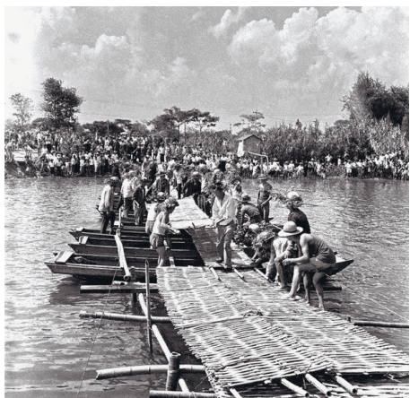
1972年,备战、备荒,南通响应号召组织民兵架浮桥演习。