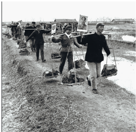
1972年,南通市郊农民在劳动。