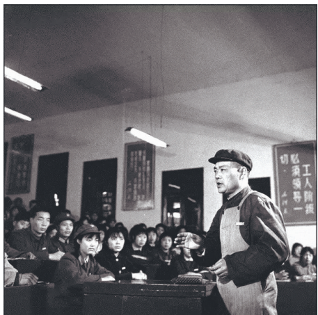
1972年,工人师傅在南通医学院的讲台上讲课。