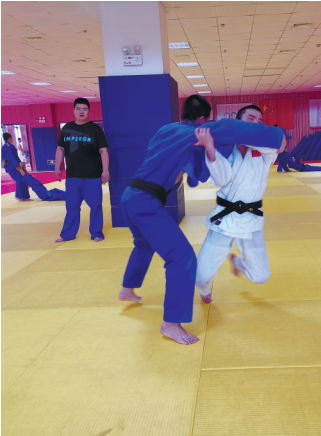
柔道队员在对弈。

目前,市体育运动学校柔道队共有35名队员,分甲组(2003年~2004年)、乙组(2005年~2006年)、丙组(2007年~2008年)三个组别。“根据目前疫情恢复情况,今年省锦标赛有望在暑