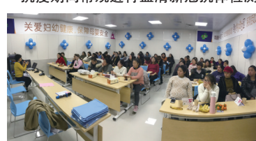
市一院“孕妇学校”走进通州湾分院