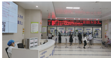
宽敞明亮的就诊大厅