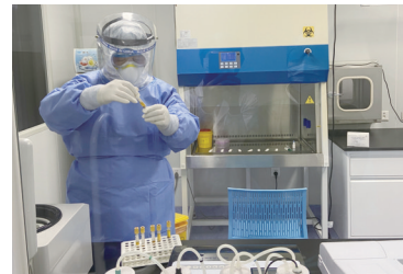
抗疫期间常规进行血清新冠抗体检测