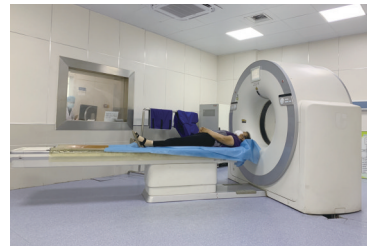
新购置的16排CT开展增强造影检查