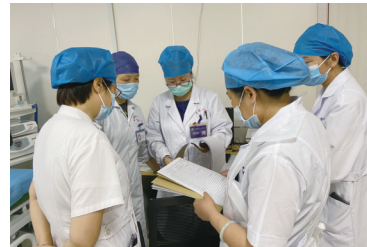
市一院专家组定期进行医疗质量督查