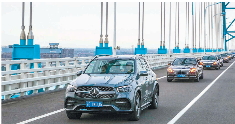
开着奔驰跨越沪苏通长江公铁大桥。 孔玮

晚报讯 昨天,本报联合南通之星奔驰举办了一场“高速高铁奔驰江海”全媒体新闻活动,沪苏通长江公铁大桥建设者、南通高铁地铁建设者、新南通建设者以及奔驰车友近100人共乘24辆奔驰车,参观南通西站,驰越沪苏通长江公铁大桥。