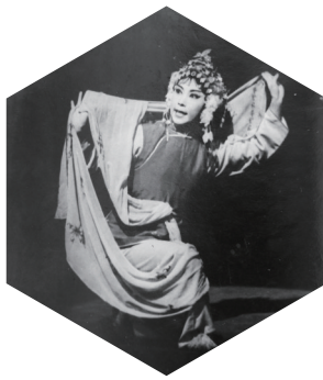
沈月凤主演《珍珠塔》剧照。