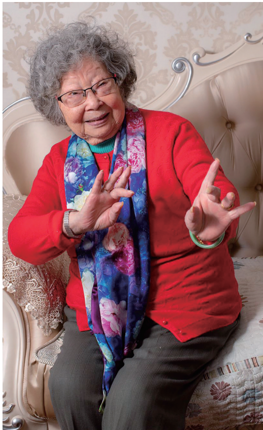
迎来百年风华的沈月凤,一招一式依然经典。

迎来99岁华诞的沈先生从艺整整87年,主演过100多部戏,塑造了《盘夫索夫》中严兰贞、《碧玉簪》中李秀英、