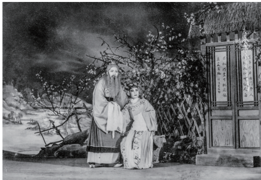
沈月凤(右)主演《人面桃花》杜宜春剧照。

作为目前唯一健在的“新越剧”改革参与者、亲历者,沈先生绵长、丰富的舞台生涯,正是越剧百年发展史的缩影。先生谦逊内敛,与诸多越界名家同台而不争春,犹如越剧艺苑的幽兰,含薰沐风、百年藏芳。沈先生也曾遭遇多舛、跌宕的人生,但她眼中始终闪烁着坚韧、坚毅的光芒,也蕴涵着豁达、包容的温暖,亦如洞察世事万物的智者,行稳致远、静水流深。