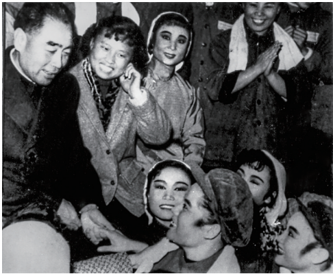
1958年,周恩来总理与《老八路》剧组演员沈月凤(左三)、指导员孔桂云(左二)等在舞台上合影。