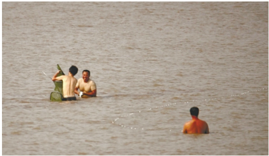
本报记者拍下的偷捕照片。

晚报讯 南通市渔政联手警方，高度重视舆论监督，从本报记者曝光偷捕视频及图片中深挖线索，成功抓获嫌疑人。4日，3名涉嫌非法捕捞的嫌疑人落网。