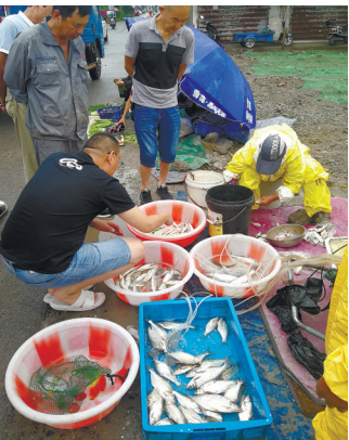
路边进行江鲜交易。记者周朝晖

问摊主。“这是米鱼,正宗的长江野生鱼,不常见的。你要不要?”记者一问价格,售价有些令人吃惊。