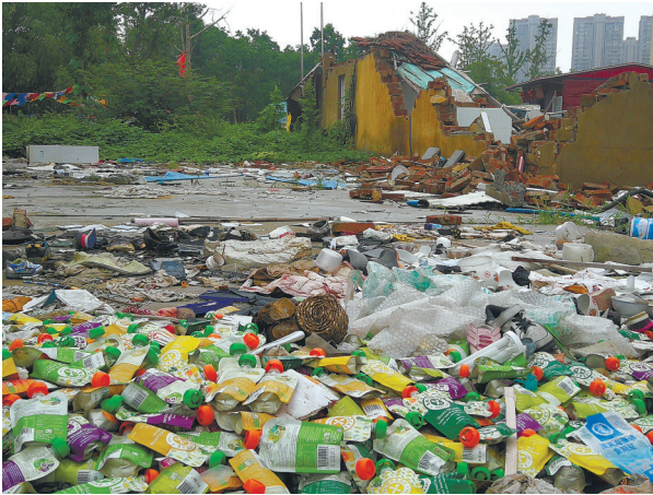
垃圾堆场一片狼藉。

现场七零八碎地散落着一堆堆建筑垃圾,其中不乏大型建筑构件。地上有数量不少的残砖碎瓦,还有几乎遍地可见的碎玻璃碴;再往里走,杂七杂八的废弃木材随处可见。