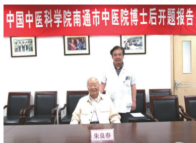
与恩师宋良春国医大师合影