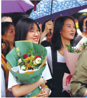
鲜花迎接考生。