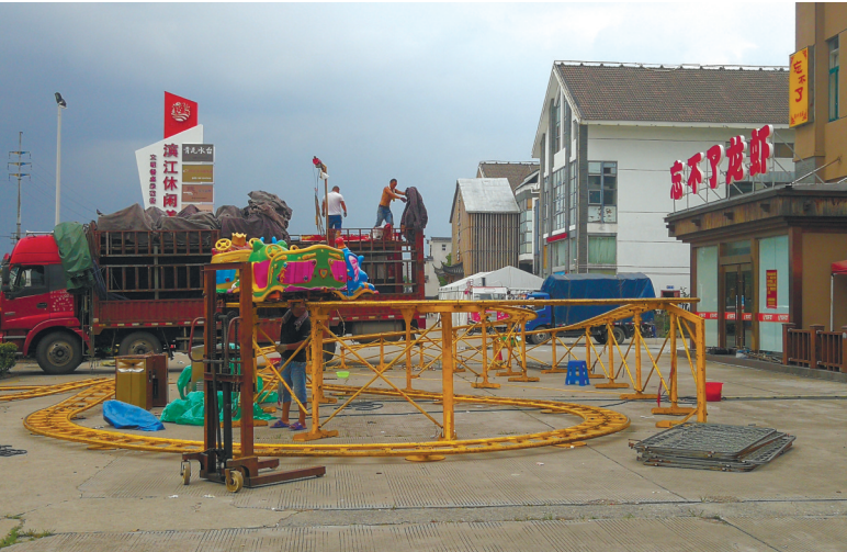
工人正在拆除“过山车”。