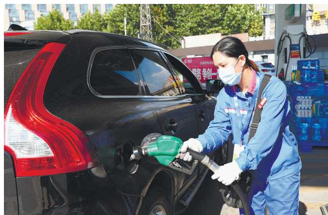
连日来,通城持续高温。中国石化各加油站,一群身着蓝工装的加油工坚守在岗位上,面带微笑为客户提供服务。目前,中国石化南通石油分公司备足货源,80%以上加油站24小时不间断为进站加油车辆提供优质服务,有效保障成品油市场供应。

南通报业分类信息线上推送平台正式开通,南通日报微信、江海晚报微信、南通发布APP同步推出,百万粉丝平台加持,有效信息轻松获取!