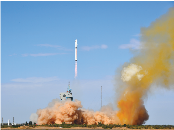
我国成功发射高分九号05星,搭载发射多功能试验卫星、天拓五号卫星。