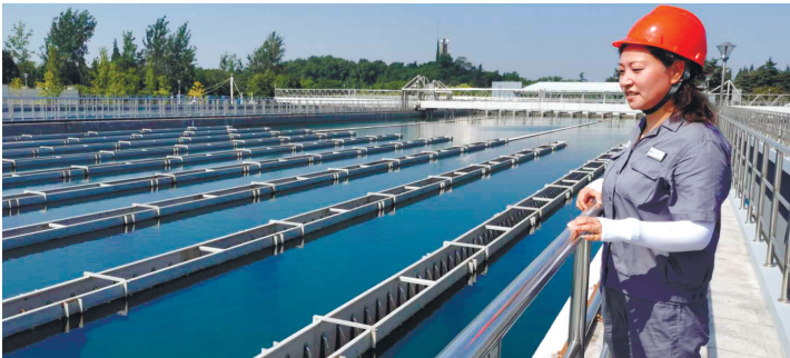
两小时 巡场一次,用 汗水守护百姓 用水安全。 记者俞慧娟

8月起,我市持续高温,用水量也是一路攀升。近半个月,日供水量已经5次刷新历史纪录,8月18日达170.6万吨。高温供水期间,如何确保市民用水无忧?上周,我们走进担负南通主城区供水任务的狼山水厂,跟随值班长沈莉莉,一起感受“高温模式”下水厂人的工作日常。