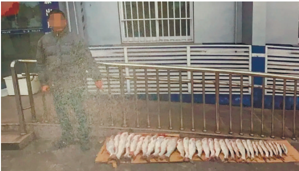
一名被告和捕到的江鱼。 张昌凤

法院审理过程中,阿丙和阿乙与公益诉讼起诉人崇川区检察院就民事公益诉讼部分达成和解协议,表示愿意承担渔业生态资源损害赔偿责任,并缴纳生态损害赔偿金等费用8011元,由南通农业农村局统