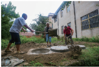
8月27日,如皋市搬经镇横埭社区3组,村民屋后三格式化粪池施工中。

市建设宣传标语;城市驿站里,正在运转的柜式空调为这个闷热的夏日送来丝丝清凉,书报、桌椅、饮用水、擦鞋器等便民服务措施让人倍感温馨。