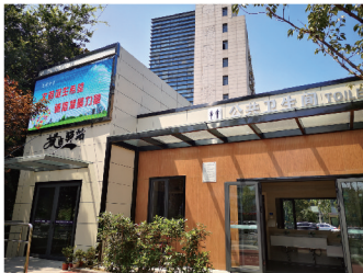
市区工农路西、人民路北小石桥游园的公共厕所。

“文明,是人生温馨的春风”“文明诞生希望,诚信凝聚力量”……25日中午10时许,走进位于市区工农路西、人民路北小石桥游园的公共厕所,LED大屏上滚动播放着精神文明城