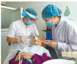
为适龄儿童开展牙齿窝沟封闭手术。 陈新

当天,南通市崇川区和汉中市佛坪县两地团委携手安利公益基金会,启动“健康口腔 健康成长”关爱儿童口腔卫生牙齿窝沟封闭公益行动。下一步,佛坪县人民医院将与佛坪城关小学和袁家庄街道办小学通力协作,按计划对500名适龄儿童有序开展牙齿窝沟封闭,预计到今年底将全部完成。主办方表示,通过此项公益行动,将为该县适龄小学生牙齿窝沟封闭工作的全面开展和倡导全民健康生活方式起到以点带面的示范和推进作用。