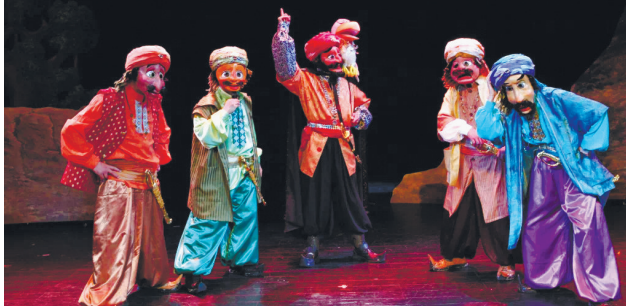
精美剧照。

晚报讯 昨天,记者获悉,9月13日下午,由上海市群众艺术馆、南通市文化广电和旅游局主办,南通市文化馆、南通更俗剧院、上海木偶剧团承办的大型人偶剧《阿里巴巴》将在更俗剧院上演。据了解,本场演出是“风从海