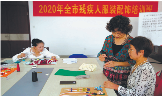
精心辅导。记者尤炼

晚报讯 双手上下翻飞,用钩针等工具编织出布艺蜻蜓、项链、布艺南瓜等钩针编织手创作品。6日,为期9天的全市残疾人服装配饰培训班圆满结束,8位残疾人女学员拿到结业证书。