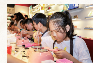
广生制皂文化体验馆