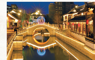
景澜·唐闸印象酒店