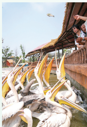
南通森林野生动物园