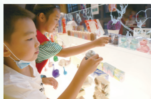
唐闸古镇广生制皂体验馆