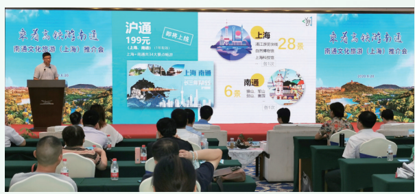
南通在沪举办文化旅游推介会