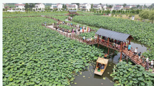
如皋平园池乡村游