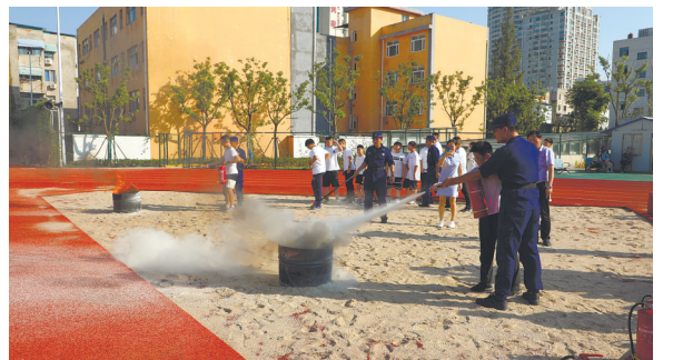
近日，启东消防深入辖区中小学校开展“消防宣传进军训”活动。 徐燕燕