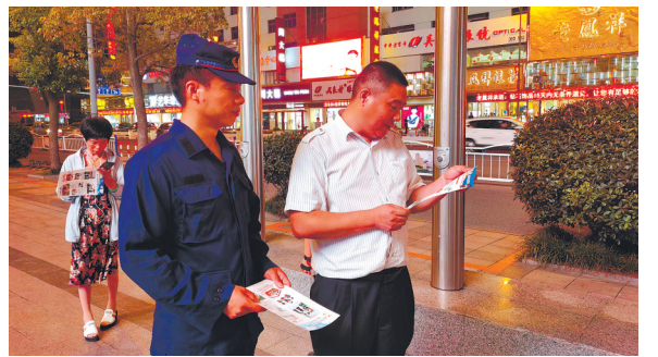
为深入推进“百日攻坚战”行动，如东消防在人员密集场所开展消防安全防火知识宣传。 朱程程