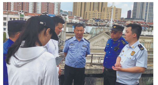
如皋消防联合城管局对群租房消防安全开展督查治理。 尹颖