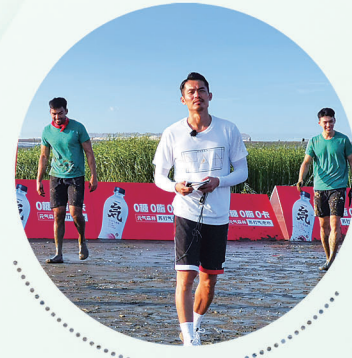
湖南卫视《运动吧,少年》在黄金海滩拍摄