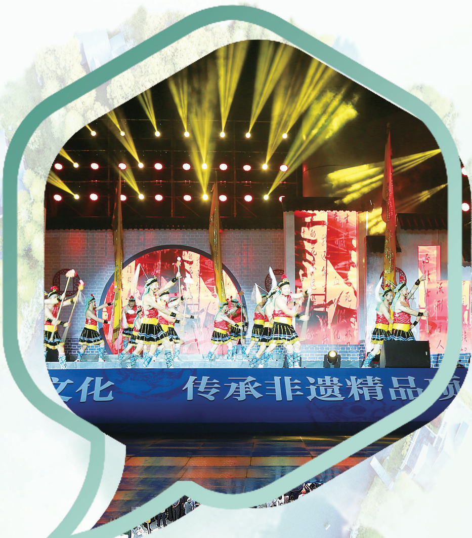
苏韵流香非遗艺术展演

在市级层面上,11个子活动中安排了5个文化方面活动,主要包括第四届江海之声合唱艺术节、全民文化节、江海美食节、“濠博有约·欢乐夜游”南通环濠河博物馆群夜场活动、“风从海上来”上海优质文化资源进南通。特别是环濠河博物馆群夜场活动,是我市文旅融合、促进夜旅游、拉动夜经济的一个新尝试。县级层面上,共安排了10个演出、展示、美食方面活动,主要有“通州之夜”系列广场文艺晚会、海门江海文化旅游节、《红楼梦作者新探》图文展、美食之夜等。组织者力争通过江海国际文化旅游节这个平台,全方位展示近年来我市文旅融合的新成果和文旅发展的新面貌。