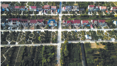
最美乡村顾庄。