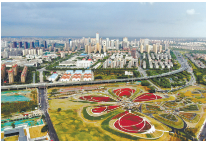
航拍滨江「生态花海」。