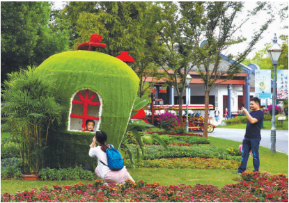
『玩趣童年 逐梦金秋』 啬园秋季百花展。

送走了炎热的夏日,南通各处已慢慢收藏起绿色的外衣,悄然泛黄迎接秋日的来临。在秋高气爽的双节假期里,带上相机,约上两三好友,在南通城里赏花想必是再惬意不过的事情了。近日,本报记者在市政园林部门专业人士的帮助下,整理了一份通城秋季赏花地图,让广大市民群众趁着这个难得的节假日去体会来自大自然的馈赠之美。