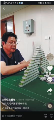
电机员闲来无事搭麻将玩。