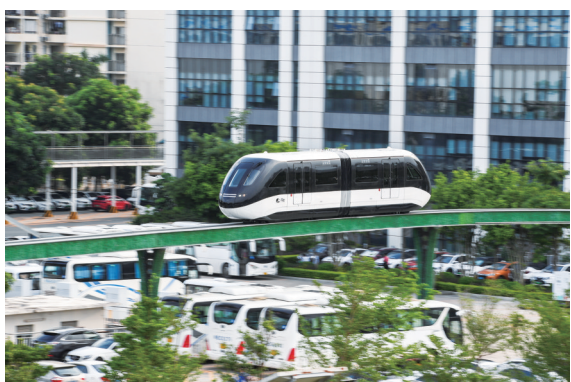
“云巴”行驶在深圳比亚迪总部园区内