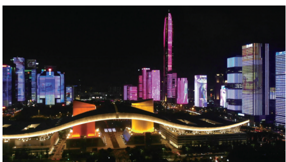
深圳福田中心区楼宇动态彩灯上演灯光秀