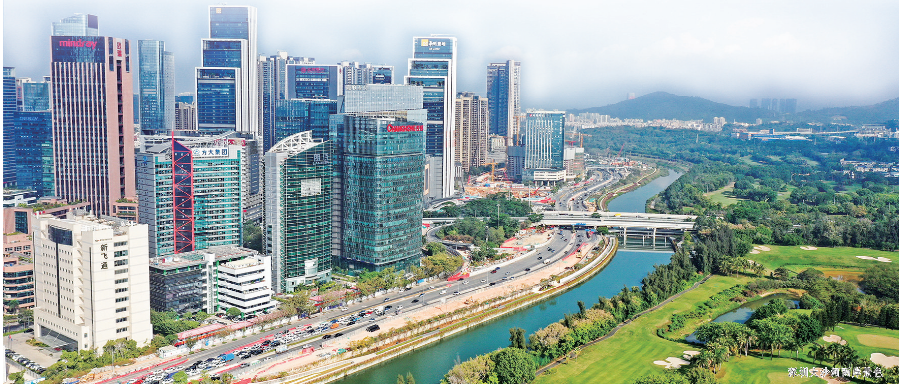
深圳大沙河两岸景色