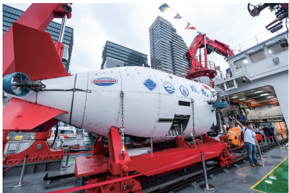
“深海一号”搭载的“蛟龙号”亮相海洋经济博览会