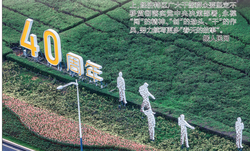
改革开放建设40周年花坛景观