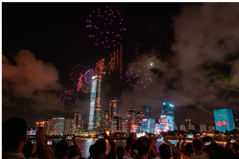
南山人才公园上演灯光秀

40年来,深圳广大干部群众披荆斩棘、埋头苦干,实现了由一座落后的边陲小镇到具有全球影响力的国际化大都市的历史性跨越、由经济体制改革到全面深化改革的历史性跨越、由进出口贸易为主到全方位高水平对外开放的历史性跨越、由经济开发到统筹社会主义物质文明、政治文明、精神文明、社会文明、生态文明发展的历史性跨越、由解决温饱到高质量全面小康的历史性跨越。深圳等经济特区的成功实践充分证明,党中央关于兴办经济特区的战略决策是完全正确的。