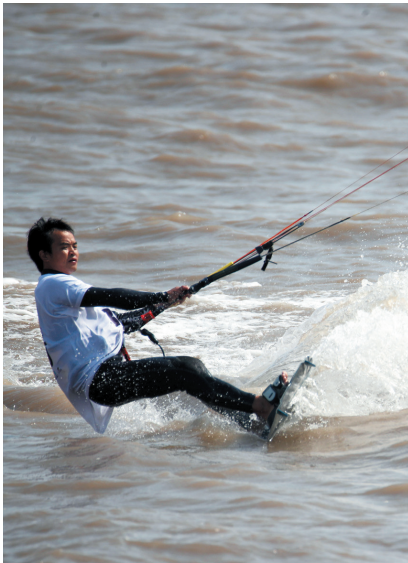
乘风破浪。 记者江建华

浪运动,使其成为圆陀角旅游度假区旅游新亮点,为推动启东国际风筝冲浪赛事走向品牌化、专业化和国际化打下基础。 记者黄海