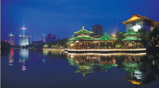
濠河夜景。

晚报讯 岸上流光溢彩、河面波光潋滟,经过夜景亮化工程的提升改造,夜晚的濠河越来越迷人。昨天,记者从市城管局获悉,濠河夜景亮化工程获得中照照明一等奖。中照照明奖是由中国照明学会2005年设立,国家科技奖励办正式批准的中国照明领域唯一的科技奖项。 根据濠河风景区整治提升现场推进指挥部的部署,围绕“一年见成效、两年大提升、三年建成精彩濠河”的目标,市城管局会同市市政和园林局牵头实施濠河风景区夜景亮化提升工程,坚持高标准谋划、高水平建设、高效能推进。基于濠河风景区“水抱城、城拥水,城水一体”的独特格局,以“时空走廊,共享濠河”为设计理念,通过特色的夜游体验和合理的光色规划,营造出7大沉浸式