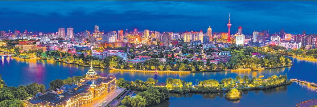
璀璨北濠河。