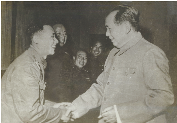
毛泽东接见志愿军一等功臣陆昌荣